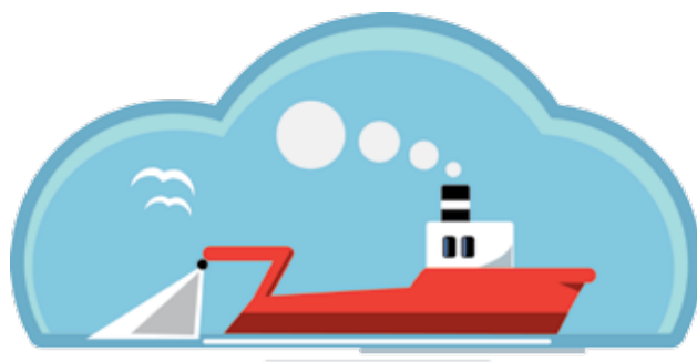
En del av EU:s utgifter går till fiskerisektorn.

Grekland, Polen och Portugal är de största nettomottagarna. Det innebär att de får tillbaka mer i form av stöd och bidrag än vad de betalar i avgift till EU. Även i förhållande till befolkningsstorlek är Grekland och